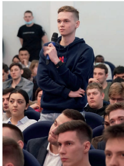
Студенты получили возможность задать вопросы экспертам о развитии газотранспортной отрасли, цифровизации и импортозамещении

лила узнать новые подробности о работе в компании и познакомиться с другими дочерними обществами.