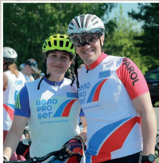
Десятый велопробег ООО «Газпром трансгаз Томск», посвященный 45-летию компании. Подробнее – стр. 13