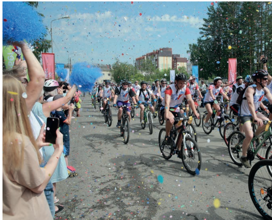
Финиш велопробега в Томске