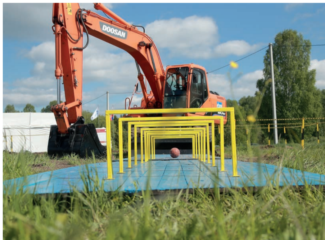
Необычное задание для машинистов экскаватора