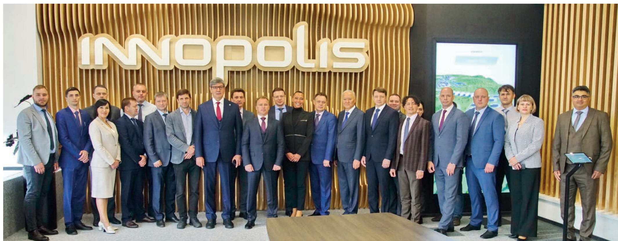
Делегация «Газпром трансгаз Томск» в Иннополисе