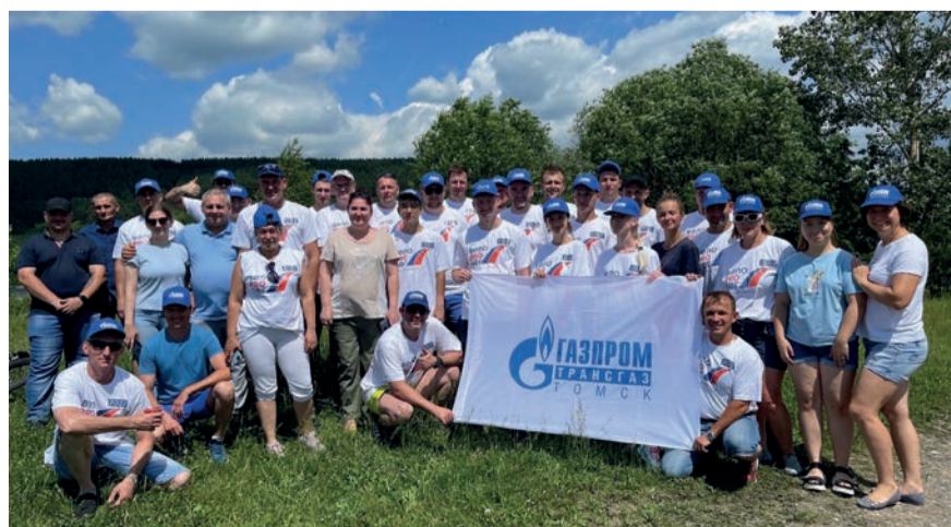
Сотрудники Новокузнецкого ЛПУМГ только что преодолели юбилейную дистанцию