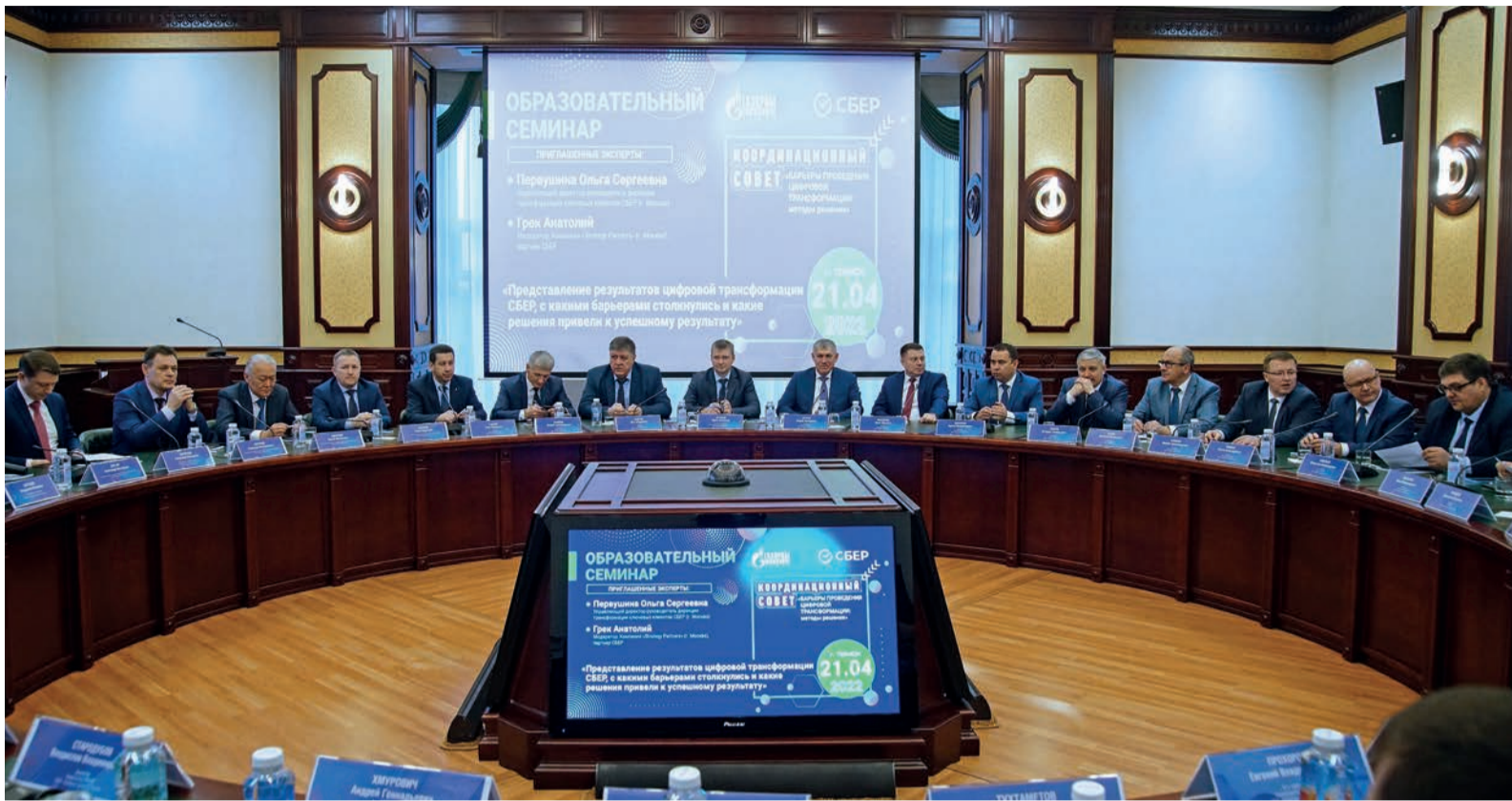
В мероприятии приняли участие руководители компании, директора всех 27 филиалов

– Это целый комплекс цифровых сервисов и продуктов, которые взаимодействуют между со-