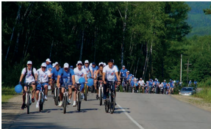
На дистанции работники Сковородинского ЛПУМГ