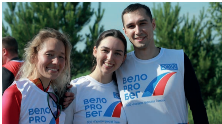
Велопробег – это в первую очередь эмоции