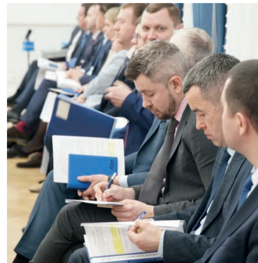
В заседаниях приняли участие руководители центров ответственности первого уровня