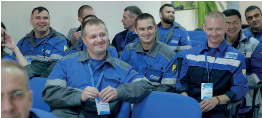
Участники конкурса «Лучший специалист по охране труда»

и организаторы, и сами участники, во многом задания были похожи на их обычную рабочую деятельность — конкурс был «жизненным». Например, машинистам экскаватора нужно было заезжать на трал, рыть траншеи и ездить под линиями электропередачи.