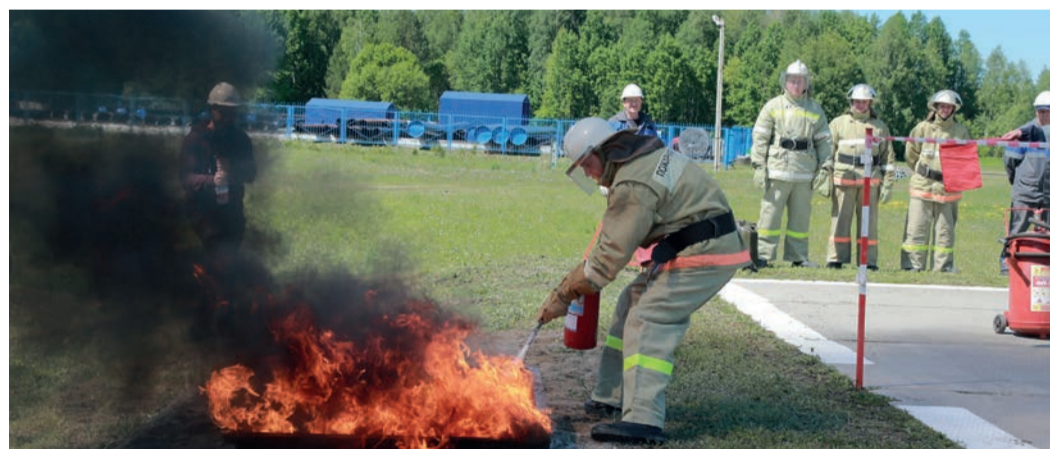
Водитель пожарного автомобиля должен уметь и сам потушить возгорание