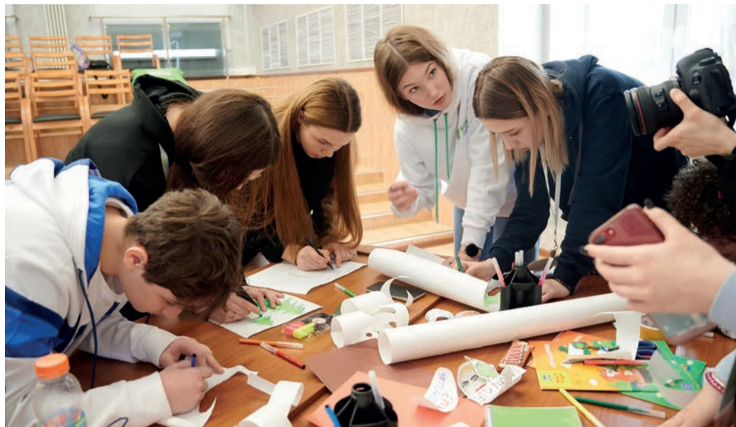
Мастер-класс по созданию мультфильмов

На протяжении всей смены школьники работали над темами проектов, полученными в первый день на жеребьевке. Организаторы сразу «напугали» участников, сказав, что поначалу о проектах в ходе подобных мероприятий обычно никто и не думает, зато ближе к защите предстоят бессонные ночи. Команда «Газпром трансгаз Томск» со всей серьезностью подошла к задаче, но... в первые дни работать над проектами было практически некогда! Лекции и мастер-классы сменяли друг друга, причем многие из них были полезны командам именно с точки зрения разработки проектов.