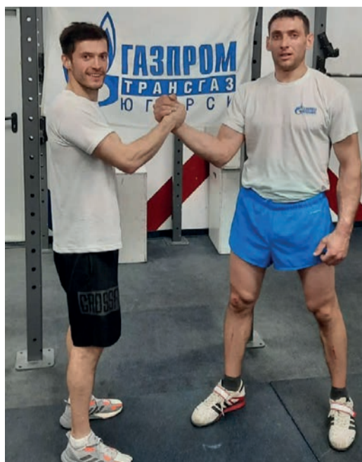
Спортсмены ООО «Газпром трансгаз Югорск» после выполнения одного из упражнений

Итоги турнира подводились в индивидуальных и командных категориях с разбивкой по возрастам. Первое и третье места в общем зачете заняли две команды ООО «Газпром трансгаз Томск», второй результат показала сборная ООО «Газпром трансгаз Югорск».