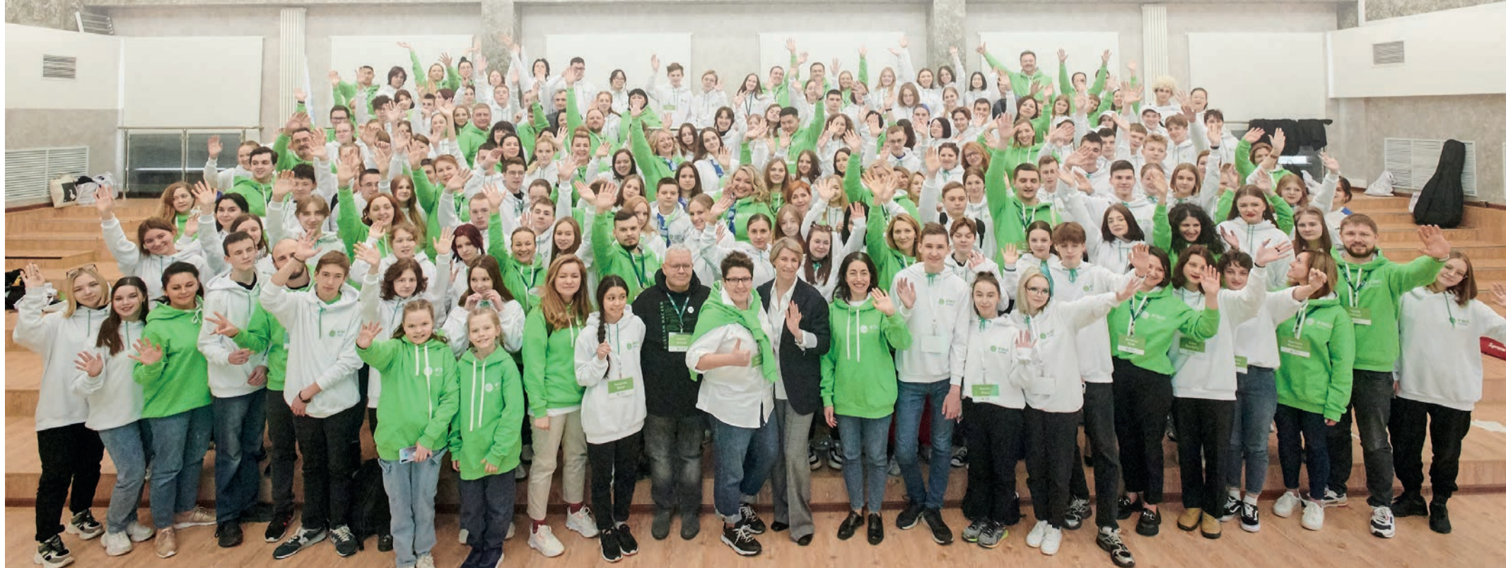
Все участники и организаторы эколагеря