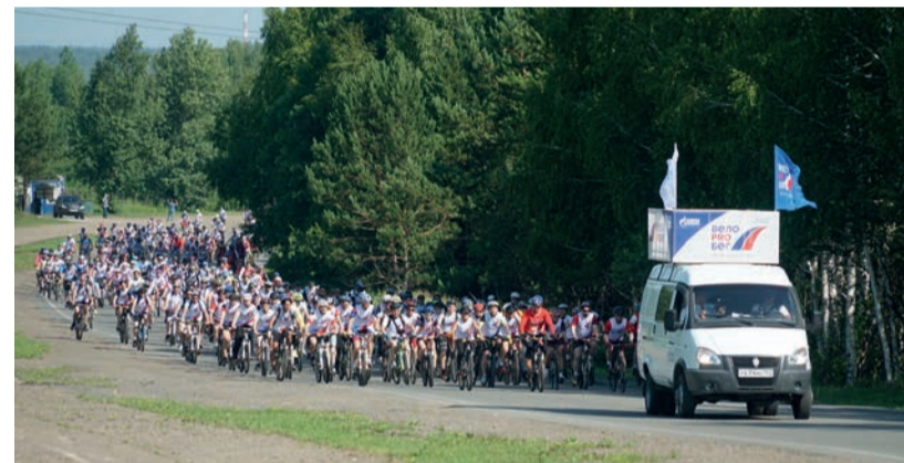
Последние метры перед привалом