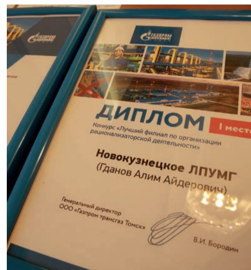
Помимо основных наград были вручены дипломы филиалам по 37 отдельным конкурсам и номинациям