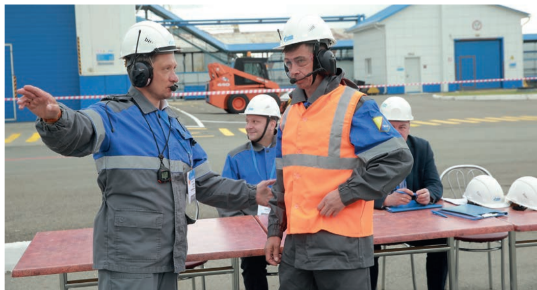
Во время конкурса «Лучший стропальщик»