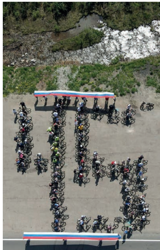
Флешмоб от газовиков Алданского ЛПУМГ