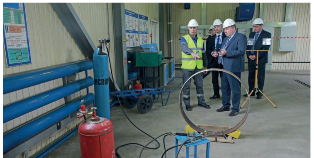
Большая часть заданий участникам знакома и встречается в их повседневной рабочей деятельности