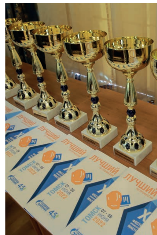
13 кубков для победителей