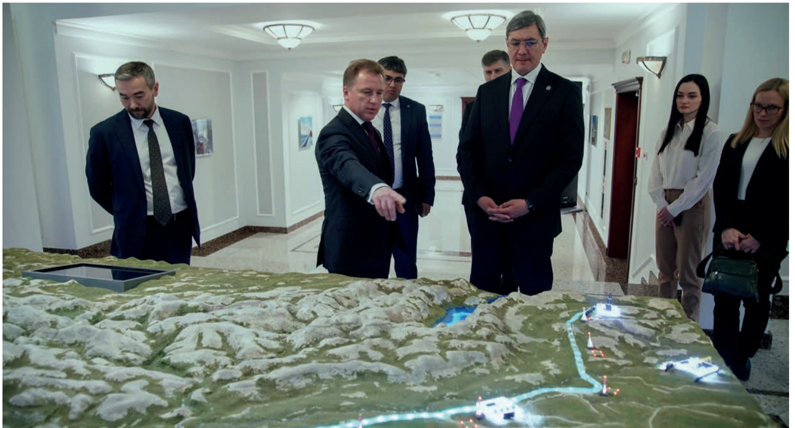
Делегация из Республики Татарстан знакомится с работой газотранспортной компании на примере макета магистрального газопровода «Сила Сибири»