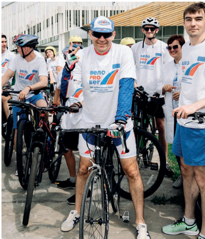
Дружный коллектив Хабаровского филиала