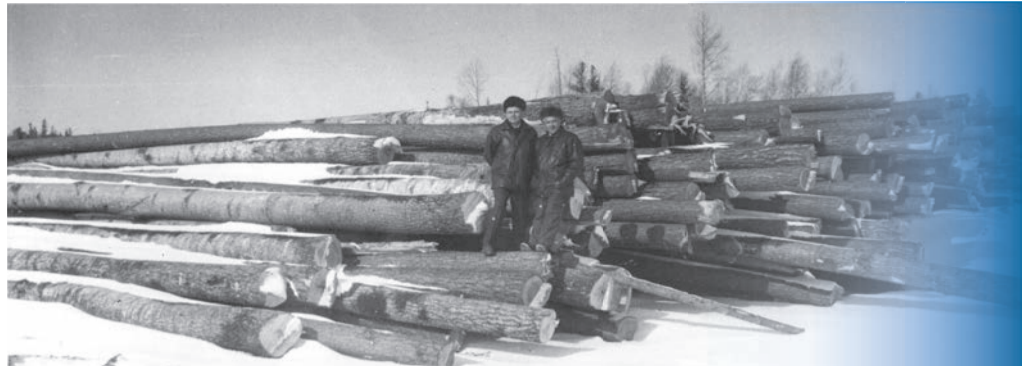
На складе Кетского лесопромышленного предприятия, 1992 год.