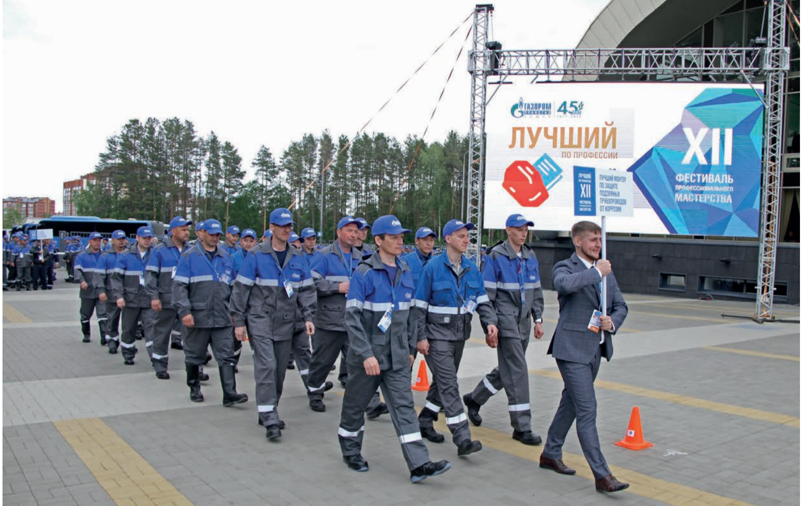
Почти 250 специалистов из 27 филиалов компании показывали свое мастерство

В каждом конкурсе участникам нужно было выполнить задания разной сложности — это не только теория, но и демонстрация профессиональных навыков. Причем, как отмечают