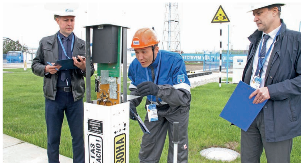
Каждое действие конкурсантов рассматривается как будто под микроскопом