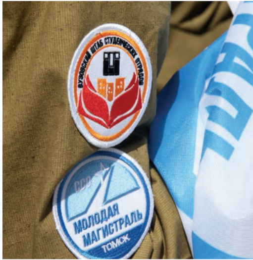
Студенческий отряд «Молодая магистраль» из ТПУ и ТГАСУ будет работать в трех филиалах ООО «Газпром трансгаз Томск»

Компания примет 32 человека из ТПУ и ТГАСУ по специальностям «трубопроводчик линейный», «оператор ГРС» и «слесарь технологических установок». Получать новый трудовой опыт бойцы студенческого отряда «Молодая магистраль» будут в течение июля этого года.