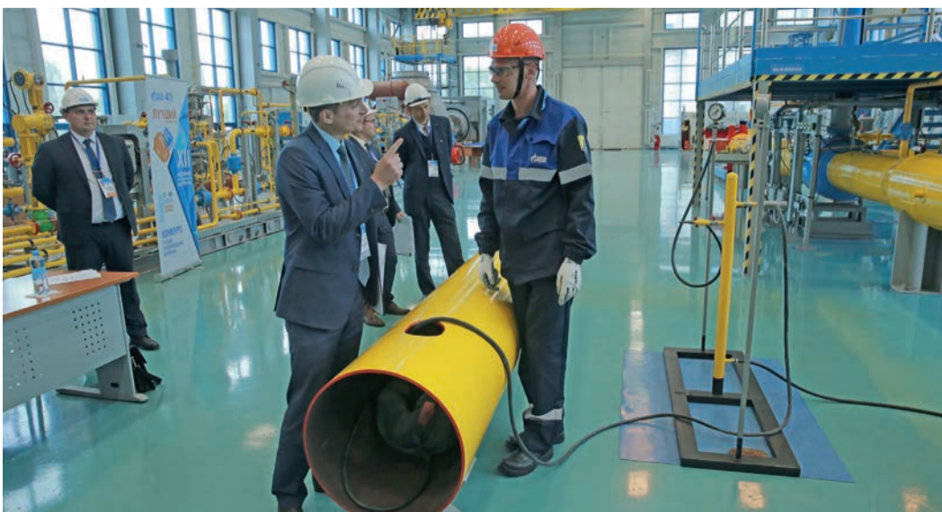
Практические задания на полигоне Корпоративного института

Здесь же, на автодроме, искусство вождения отрабатывают водители автобуса. У них своя специфика: главное, чтобы пассажир был