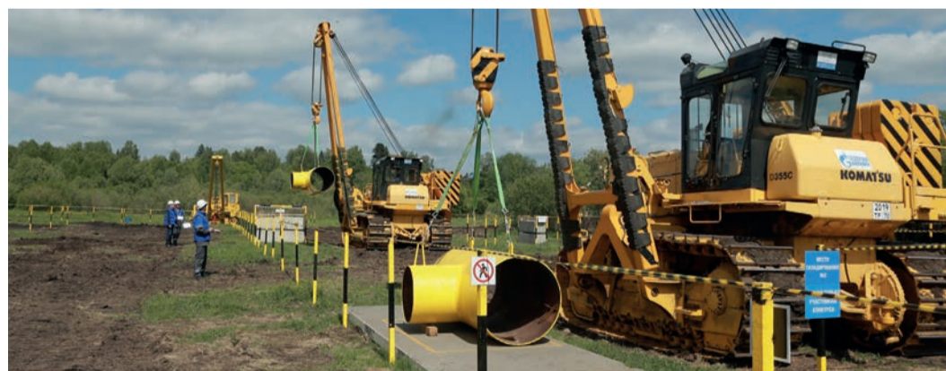
Подготовить площадку для конкурса «Лучший машинист трубоукладчика» оказалось непростой задачей