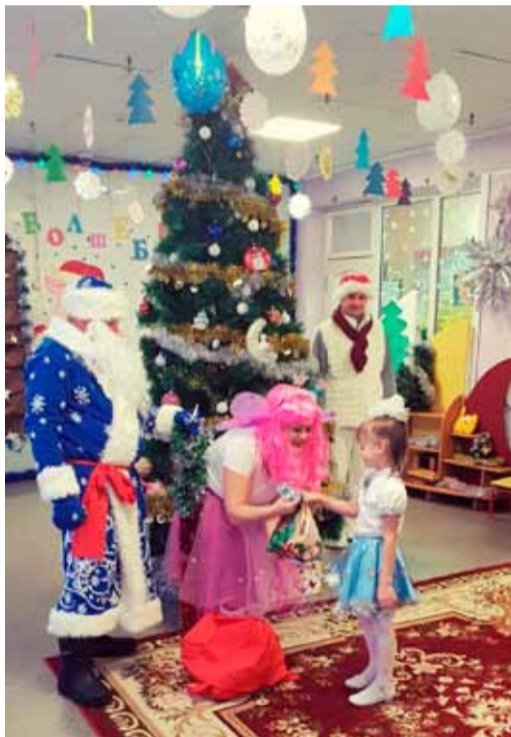
Подарки от Сахалинского ЛПУМГ