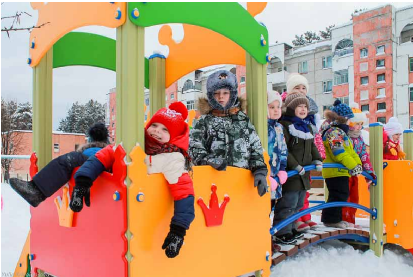
Воспитанники детского сада «Родничок» радуются новой площадке

Новым красочным комплексом для детей пополнилась не только центральная пло-