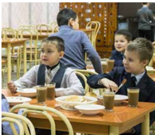
На средства компании модернизированы пищеблока в школе и детских садах Кедрового