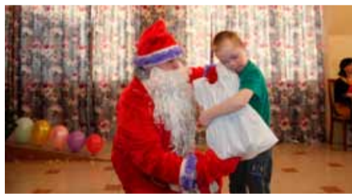
Сотрудники Новосибирского ЛПУМГ перед Новым годом посетили сразу несколько детских учреждений