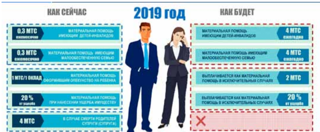
Гарантии особым категориям работников

В-третьих, поддержка работников, оформивших опеку, а также попавших в сложные ситуации (при краже, пожаре, наводнении), с нового года будет оказываться не в виде компенсационной выплаты, а по заявлениям об оказании материальной помощи в исключительном случае.