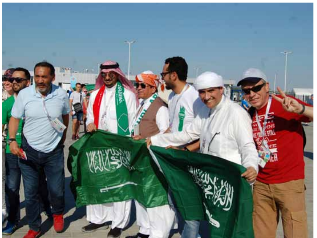
Александр Голубев и футбольные фанаты