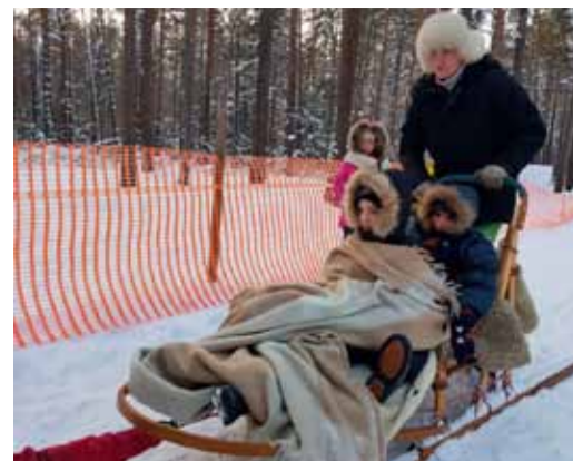
Сотрудники УМТС и К прокатали детей на санях, запряженных якутскими лайками

По закону жанра волшебной сказки добрых и наивных героев – поросят – хотят обмануть коварные Белладонна и Сорока. Но добро побеждает зло, и в этом милым поросьятам помогают Дед Мороз и Снегурочка. Их уже на протяжении многих лет играют работники Кемеровского управления.