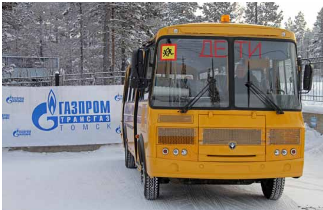
Газовики подарили новый автобус для перевозки детей департаменту образования Алданского района