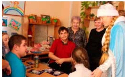
Работники Парабельской ПП Томского ЛПУМГ побывали в организации детей-инвалидов «Мы вместе»