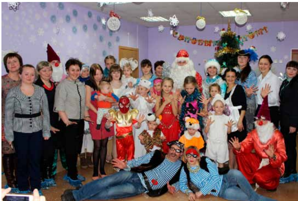
Сказочное представления для детей из детского дома «Надежда» от Юргинского ЛПУМГ

Представители Сковородинского ЛПУМГ в преддверии Нового года в рамках договора благотворительного пожертвования с админи-