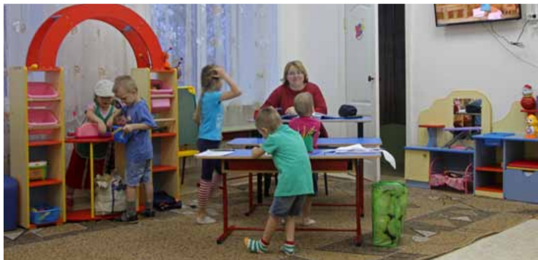
Нерюнгринский социально-реабилитационный центр для несовершеннолетних «Тускул» находится под постоянной опекой местного филиала компании «Газпром трансгаз Томск»

зинах постоянно. До конца декабря 2018 года работы на данном участке будут завершены.