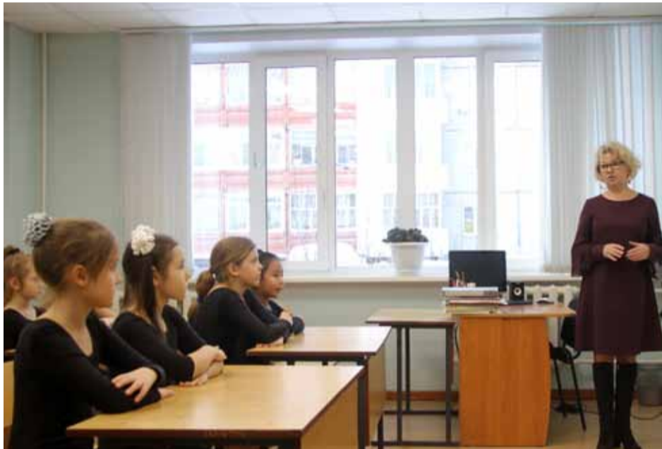
В детской школе искусств г. Нерюнгри журналистам показали музыкальные инструменты, приобретенные на средства ООО «Газпром трансгаз Томск», — фортепиано «Ямаха», баяны «Тула», клавиолы

После поездки к подводному переходу журналисты стали свидетелями торжественной церемонии передачи в дар от ООО «Газпром трансгаз Томск» районному департаменту образования нового автобуса для перевозки детей. Также журналисты посетили социаль-