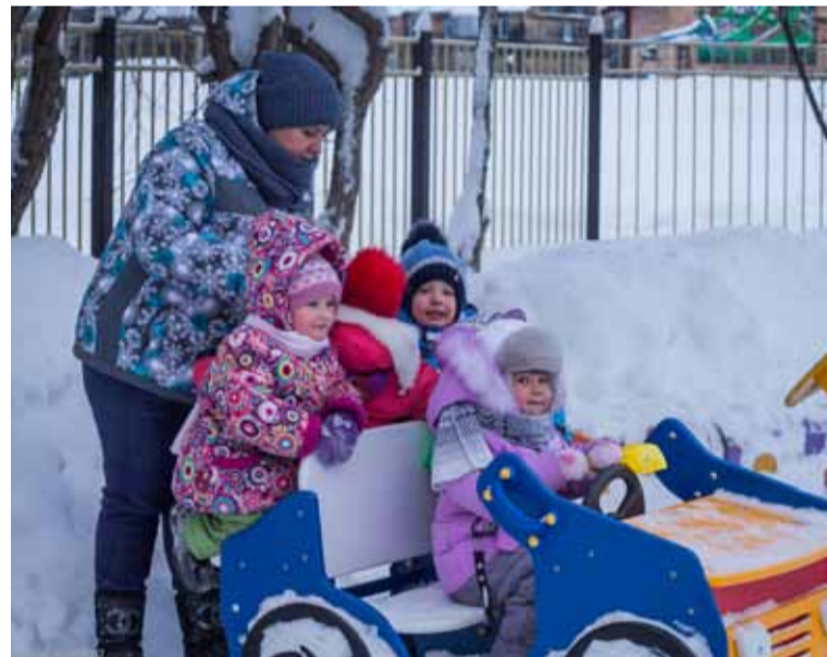
Более 12 млн руб. вложила компания «Газпром трансгаз Томск» в социальную сферу г. Кедрового