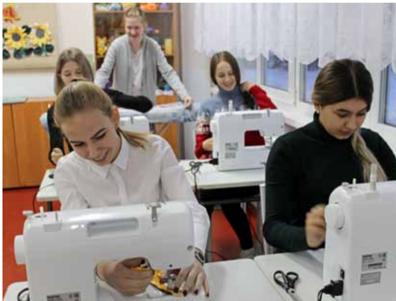
Местная школа благодаря газовикам регулярно оснащается необходимой техникой и оборудованием