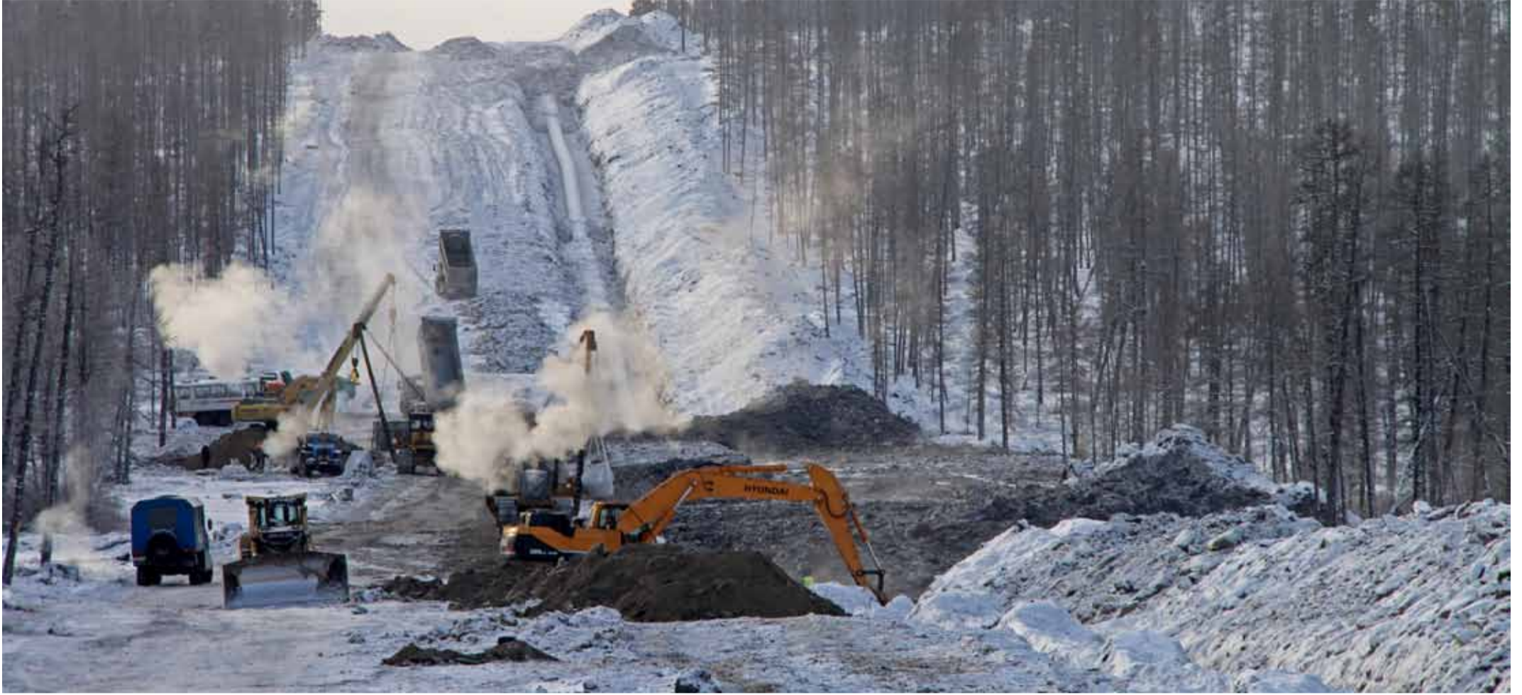
Линейная часть магистрального газопровода «Сила Сибири» сварена и уложена почти полностью – остались считанные километры