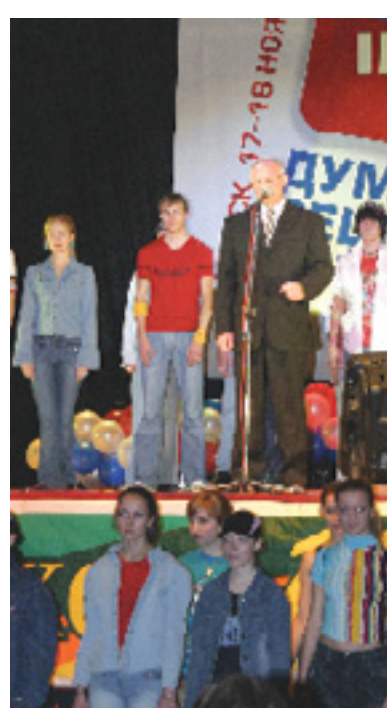
Всероссийский форум студентов.