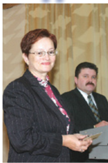
Оксана Козловская вручает памятную медаль.

В год 400-летия Томска администрация Томской области подготовила награды трудовым коллективам предприятий и организаций, чей вклад в развитие региона был оценен как наиболее значимый и весомый. Также внимание было оказано и одному из самых больших и заслуженных коллективов области — «Томсктрансгазу». Памятные медали 57 сотрудникам томских подразделений предприятия вручал зам. губернатора Томской области по экономике Оксана Козловская.