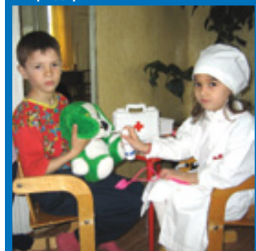
Вертикос, Александровское, Чакемто, Парель, Володино

В декабре в «Томсктрансгазе» стартует новая медицинская программа, ориентированная на детей сотрудников предприятия.