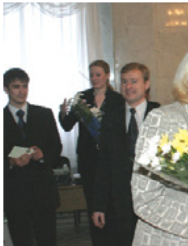
Вручение памятных медалей.

Памятные медали вручались по совместному постановлению Государственной Думы Томской области, губернатора Томской области. Таких