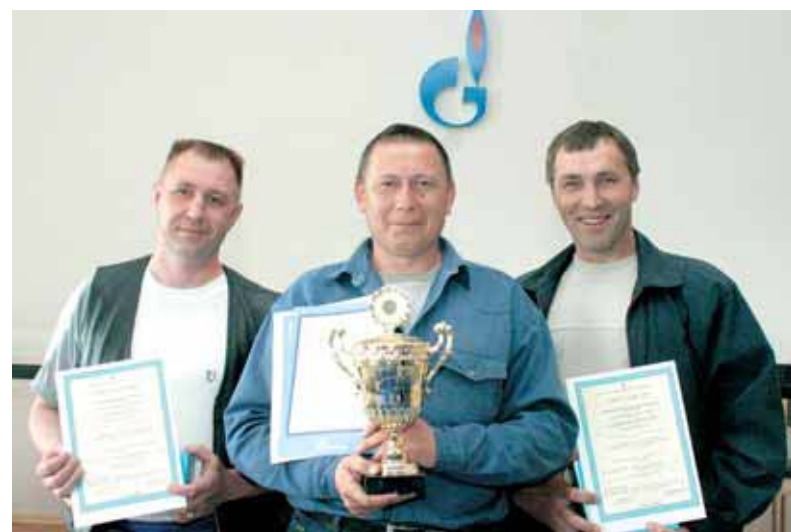
▲ Лучшие сварщики «Томсктрансгаза»

В «Томсктрансгазе» прошла спартакиада, посвященная 60-летию Победы. В ней участвовали девять команд. В основном это были подразделения, базирующиеся в Томске, но кроме них приехала сборная из Юргинского ЛПУ, а также были приглашены спортсмены родственного «Согаза». Общее число участников — 216 человек, но споркомплекс поселка «Зональный» был заполнен до отказа, потому что болельщики не оставили игроков в гордом одиночестве.