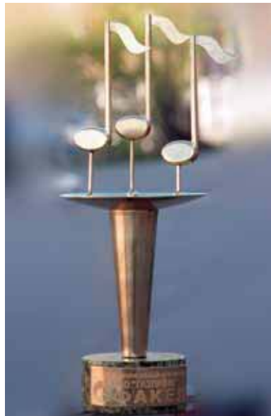
▼ Символ нашего триумфа

Так председатель правления ОАО «Газпром» Алексей Миллер охарактеризовал фестиваль «Факел», финал которого прошел в середине мая в Геленджике. Участниками фестиваля стали дочерние предприятия и общества ОАО «Газпром». В номинации «бальные танцы» первое место занял творческий коллектив ООО «Томсктрансгаз».