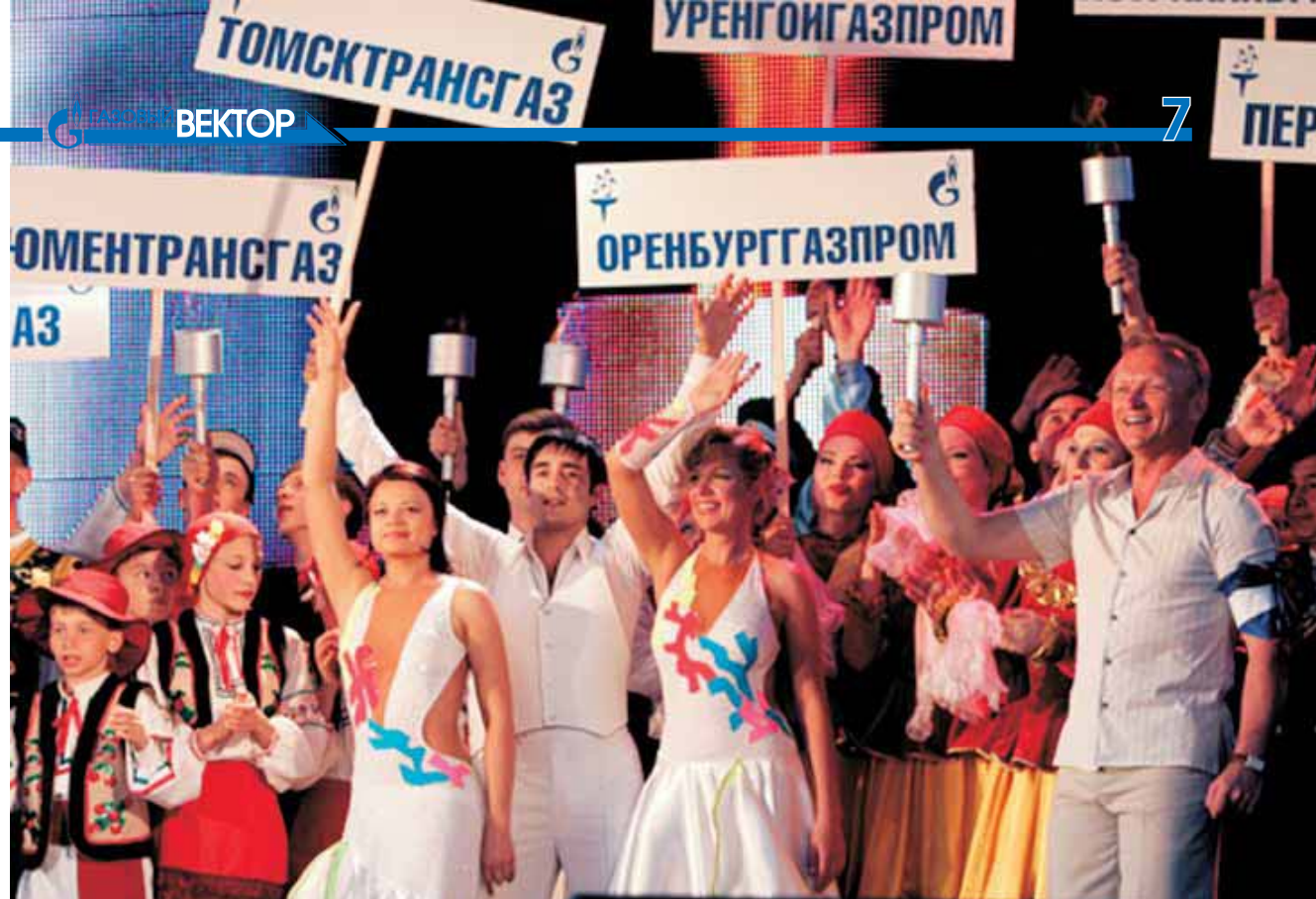
▲ «Факел» объединяет города

На родной земле, в томском аэропорте танцоров встречали как героев, что было вполне заслужено. Ведь прошло всего год и три месяца после того, как начались репетиции и в итоге такой успех. На выступлении Томичей в финале фестиваля, случайному зрителю уже не так просто было догадаться о том, что зажигательную «латину» и классический вальс исполняют вовсе не