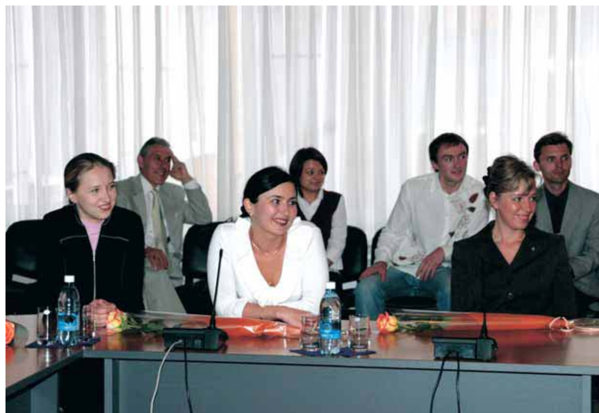
▲ Поздравления руководства “Томсктрансгаза”