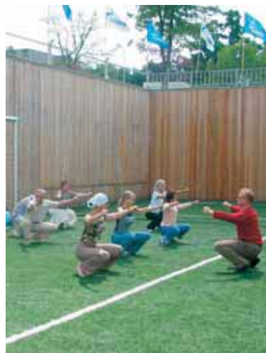
▲ Упорные тренировки накануне