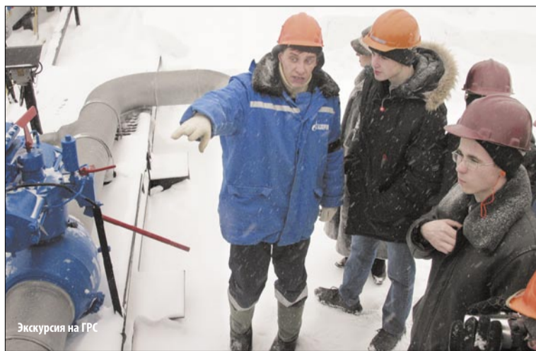
Экскурсия на ГРС

вчонок из Вертикасса, Томска, Александровского, Барабинска, Новосибирска, Володина, Парабели, Светлого, Северска, Барнаула, Нижневартовска, Юрги и Новокузнецка целую неделю занимались стоящим делом – планированием собственной карьеры.