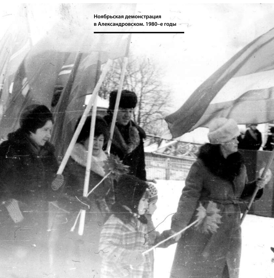
Ноябрьская демонстрация в Александровском. 1980-е годы