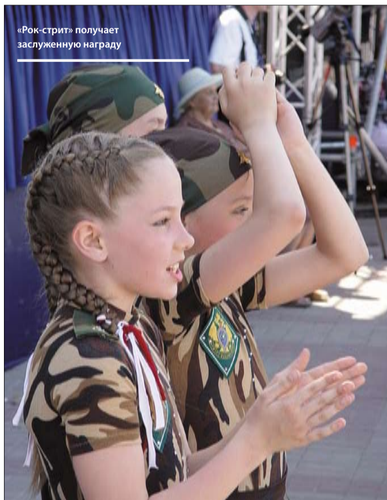
«Рок-стрит» получает заслуженную награду

Александра Пахмутова, народная артистка СССР, видит проблему по-своему: