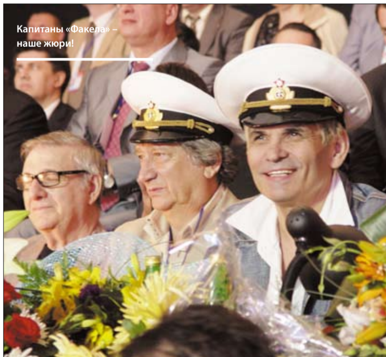
Капитаны «Факела» – наше жюри!