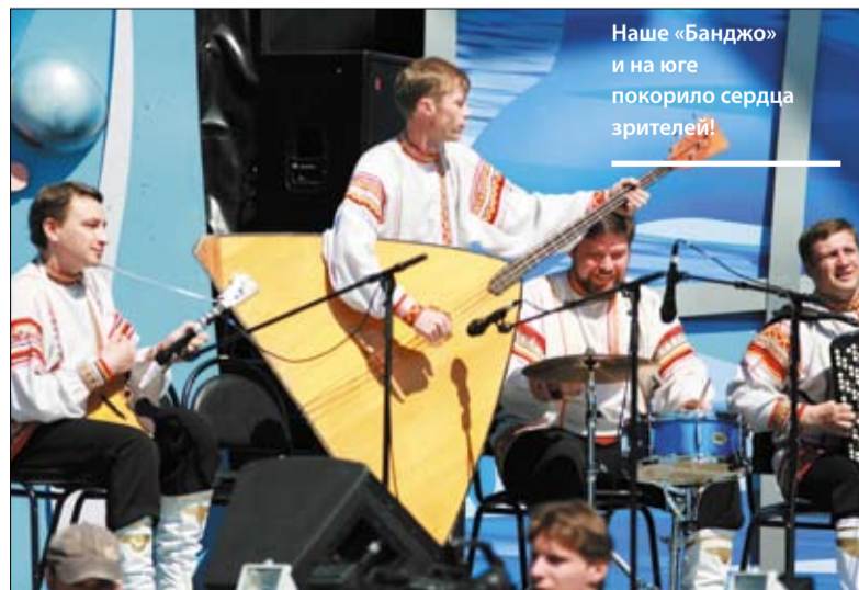
Наше «Банджо» и на юге покорило сердца зрителей!