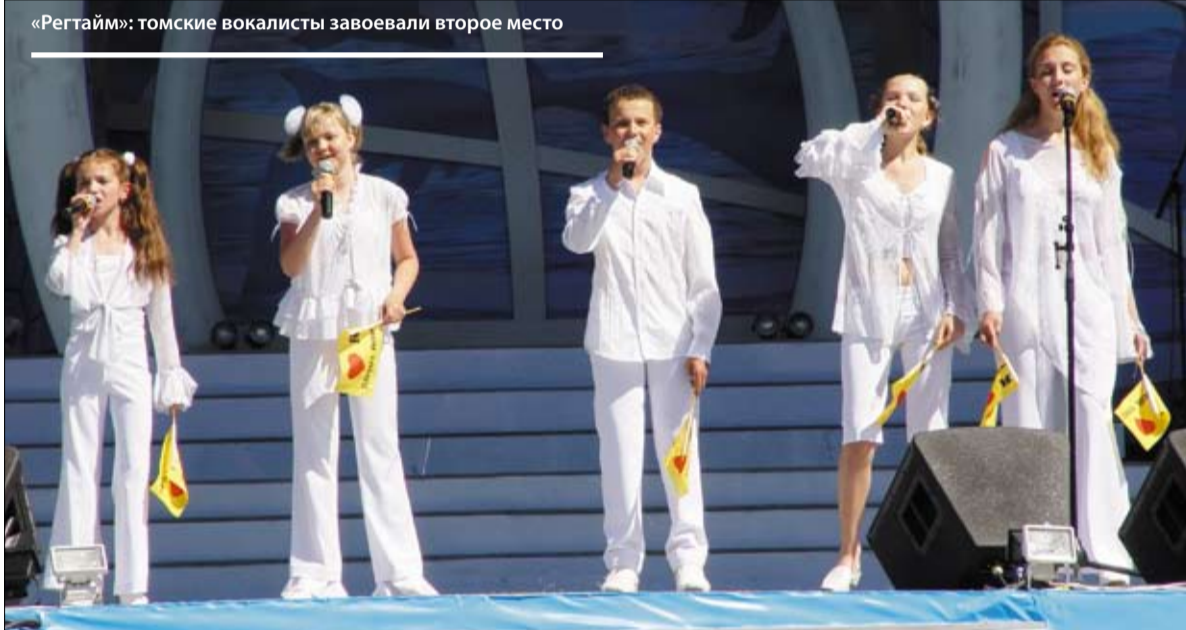
«Регтайм»: томские вокалисты завоевали второе место

Надеемся, что среди претендентов на эту поездку будут и представители Томсктрансгаза.