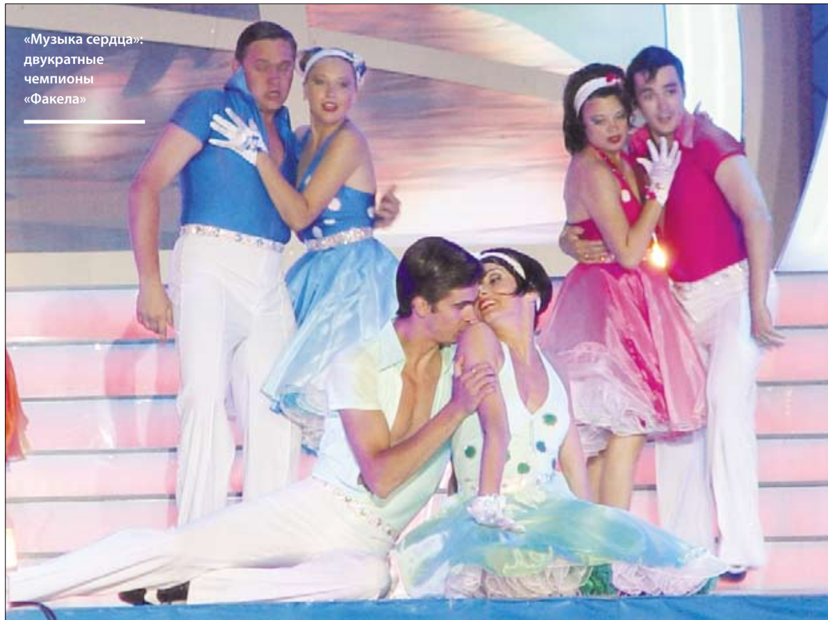
«Музыка сердца»: двукратные чемпионы «Факела»