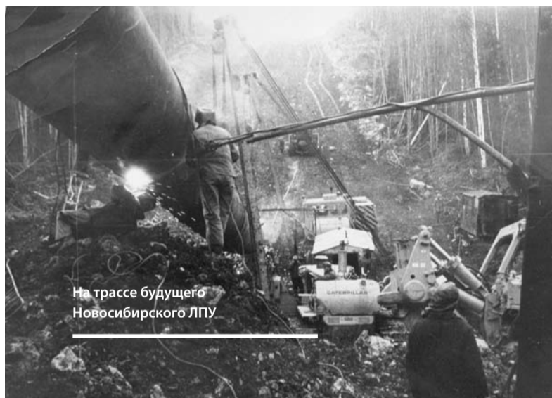
На трассе будущего Новосибирского ЛПУ