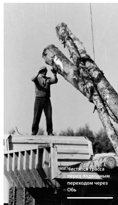
Чистится трасса перед подводным переходом через Обь