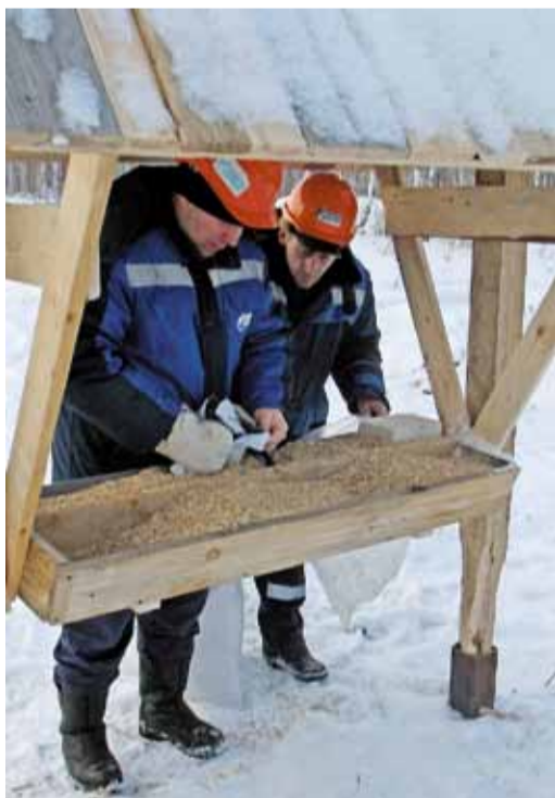
С заботой о братьях наших меньших – зимняя столовая

И встречи газовиков с разной лесной живностью здесь не редкость. Летом неподале-