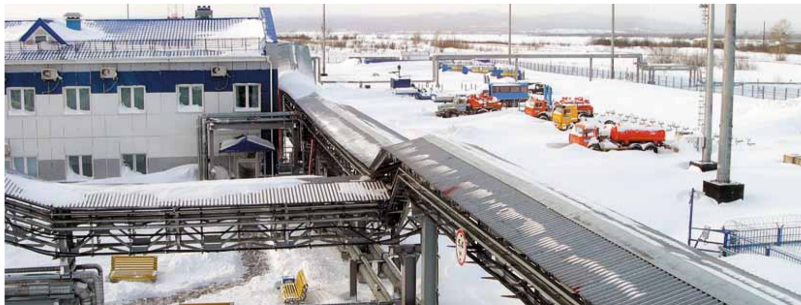
Производственная база Амурского филиала после циклона