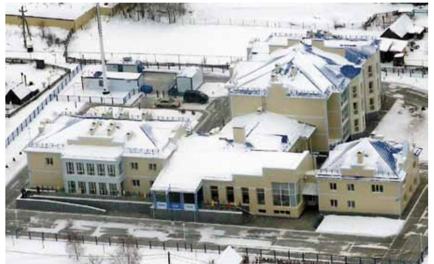
Здание стоит в самом центре старинного сибирского села