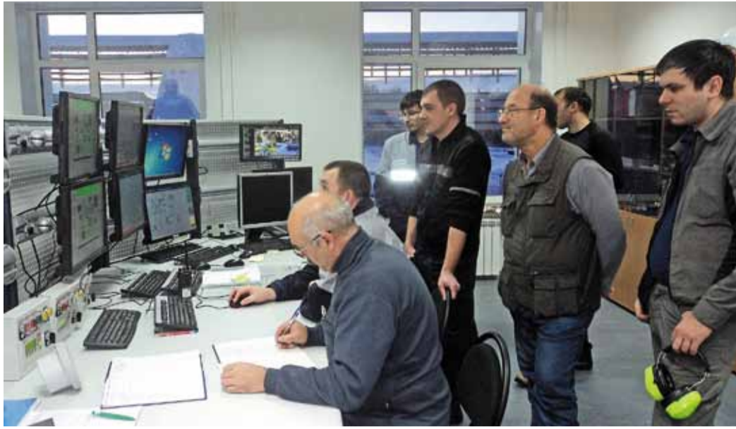
Диспетчерская КС «Александровская» – последняя точка в большом проекте

Темпы строительства были, как всегда, ударные. Если в апреле этого года КС «Александровская» представляла собой лишь здание с «черновой» отделкой, где стояли ещё нераспакованные ГПА, то уже в сентябре в зале нагнетателей было полностью смонтированное оборудование, дорожки на территории аккуратно отсыпаны щебнем и выложены бордюрами, а вместо сварочных работ на обвязке новой КС можно было наблюдать свежевыкрашенные краны и трубопроводы.