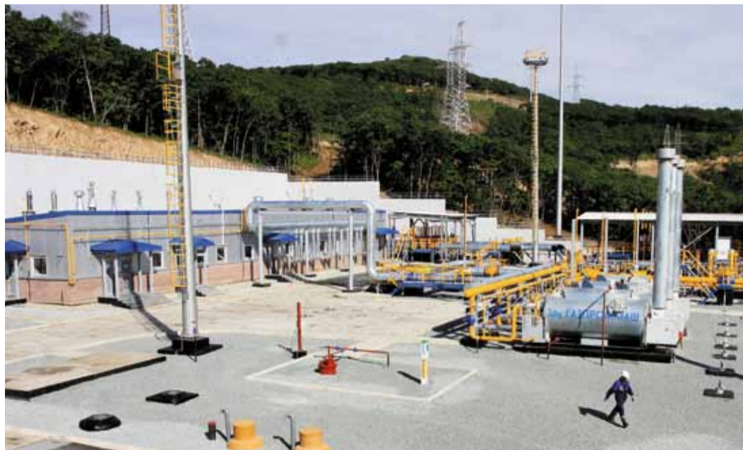
Малолюдные технологии – завтрашний день газовой промышленности