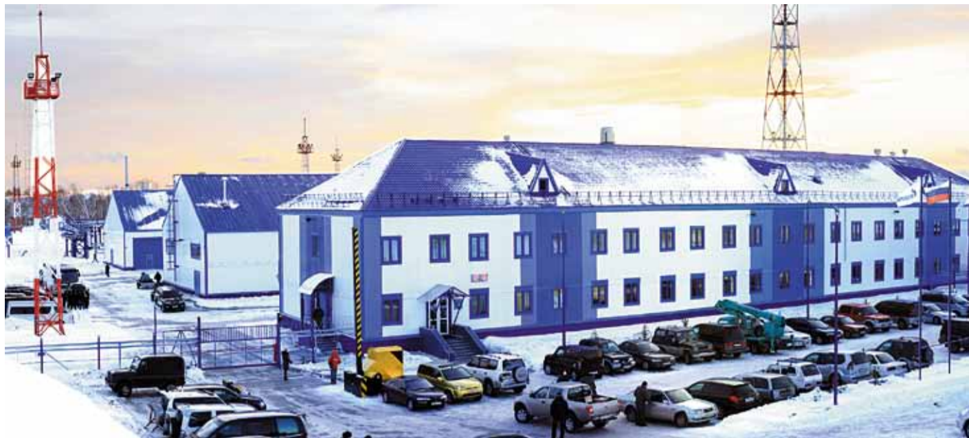
База Камчатского ЛПУМГ в городе Петропавловск-Камчатский