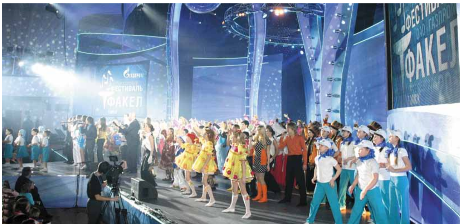
Томск стал северной столицей корпоративного фестиваля «Факел»

В уходящем году компания дала возможность заявить о себе многим талантам. Прошедший региональный фестиваль «Новые имена» стал открытым для всех желающих в нем участвовать. А корпоративный фестиваль «Факел»,