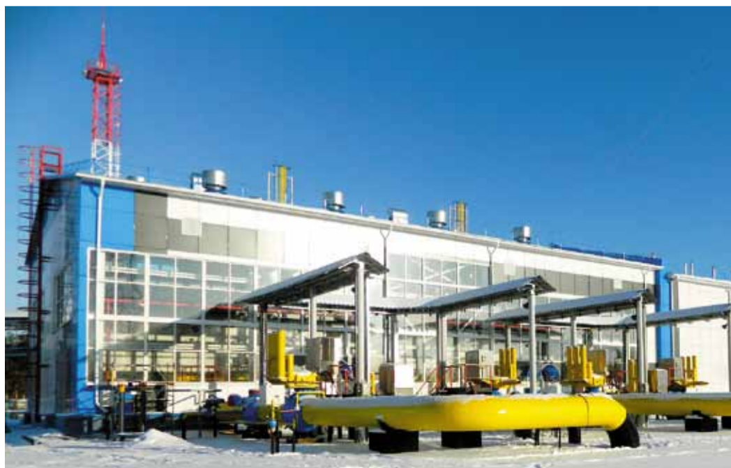
Технический прогресс пришел и на КС «Чажемто»