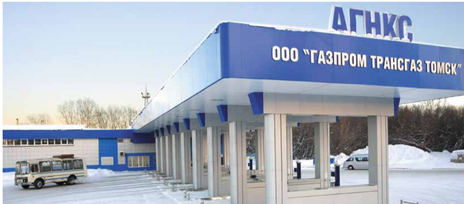
Наиболее активны на рынке газомоторного топлива новокузнецкие партнеры компании