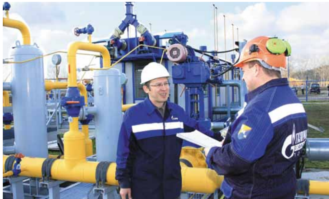
Социальное и профессиональное развитие коллектива – вопросы, не уходящие с повестки дня компании

лой комплекс компании – красивый современный объект, ставший украшением населенного пункта. Комплекс, состоящий из общежития на 25 мест, кафе и 12-квартирного жилого дома, был построен меньше чем за год. Все помещения выполнены с использованием современных материалов, на высоком дизайнерском уровне. Большие габариты, продуманная планировка, оборудованные санузлы, спутниковое телевидение – достойный уровень жизни молодых специалистов, выбравших местом своей работы компрессорную станцию «Вертикос».