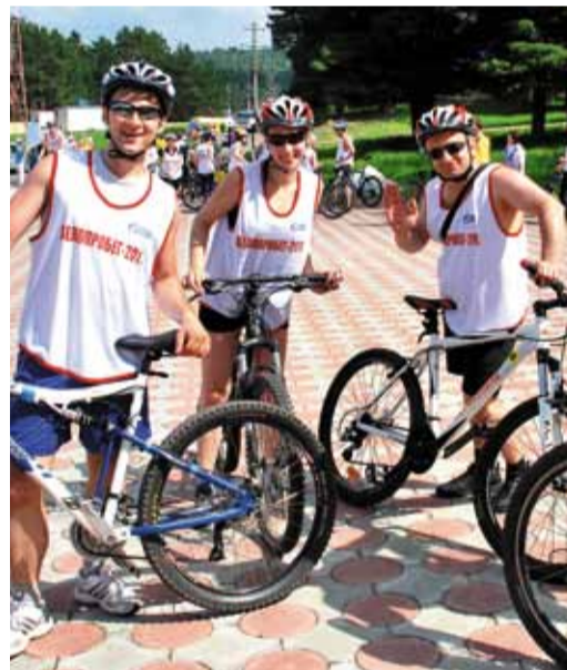
Велопробег привлек немало сторонников здорового образа жизни