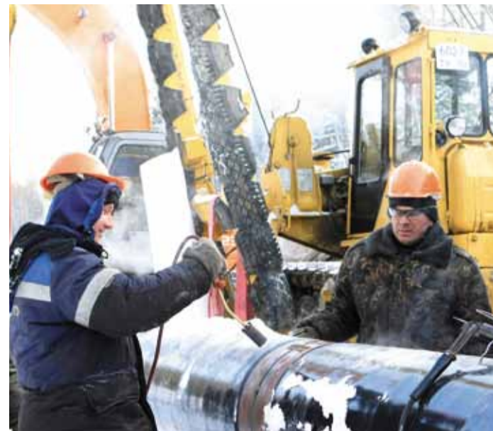
Модернизация линейной части газопроводов – залог надежных поставок газа