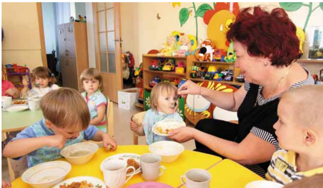
В будущем году газовики начнут модернизацию столовых в детских садах