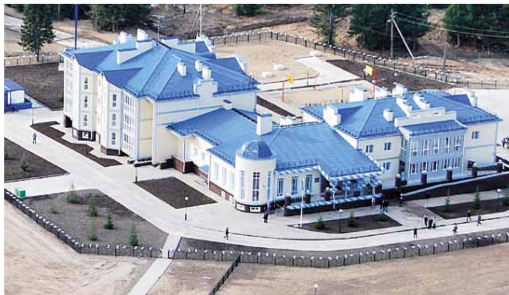
Жилой комплекс в селе Вертикос Томской области

Полномочный представитель Президента Российской Федерации в Сибирском федеральном округе В. Толоконский