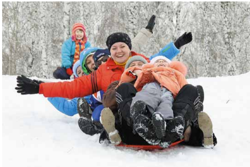
Год здоровья провожают не только работники компании, но и члены их семей

Собственно, так и формулировалась задача: задать мотивацию к здоровому образу жизни у каждого работника – от линейного трубопроводчика на трассе до ведущих специалистов в администрации. Был предложен целый комплекс мер по профилактике соци-