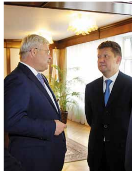
Кабинет губернатора Томской области: перед подписанием важных документов