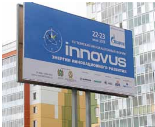
Символика форума на улицах города

Объем финансирования актуальных научно-исследовательских и опытно-конструкторских разработок, выполняемых ООО «Газ-