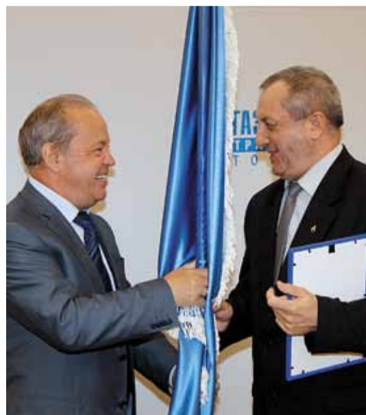
Омское ЛПУМГ в седьмой раз, начиная с 2003 года, становится победителем по результатам производственной и социально-культурной деятельности в 2012 году