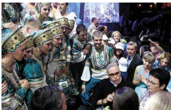
Заинтересованный разговор профессионалов