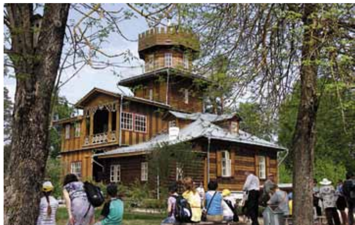
Музей-усадьба Ильи Репина – место вдохновения художников