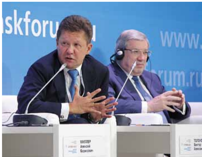
Алексей Миллер: «Газпром – это инновационная компания»