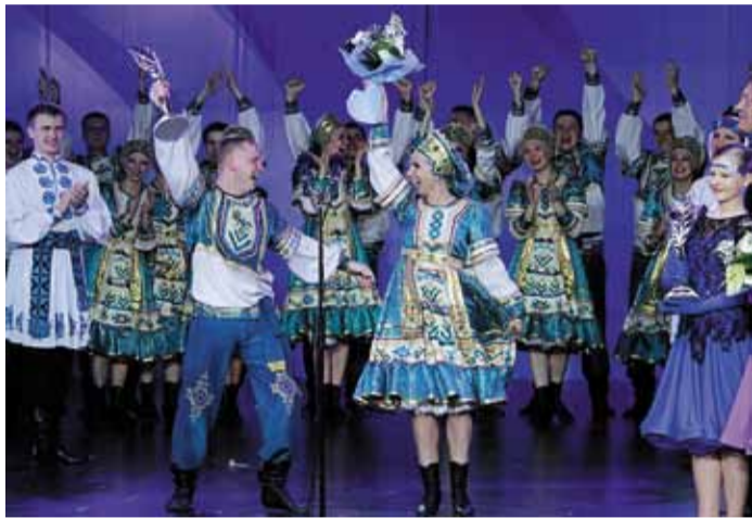
«Сибирский сувенир» дважды был признан лучшим на фестивале «Факел»