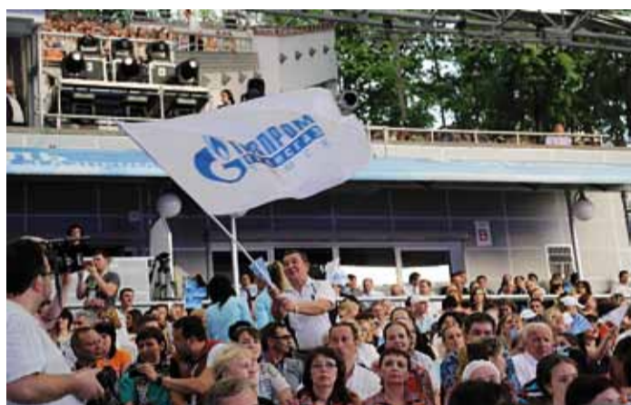
Самые искренние болельщики – томичи