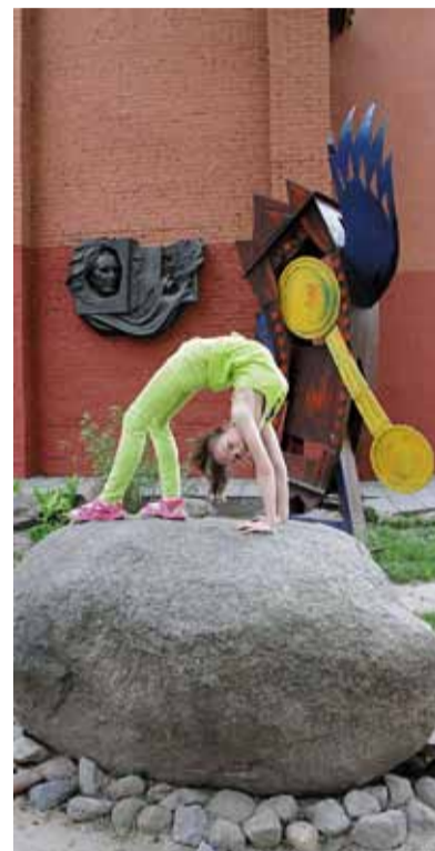
Импровизированный этюд на фоне Шагала