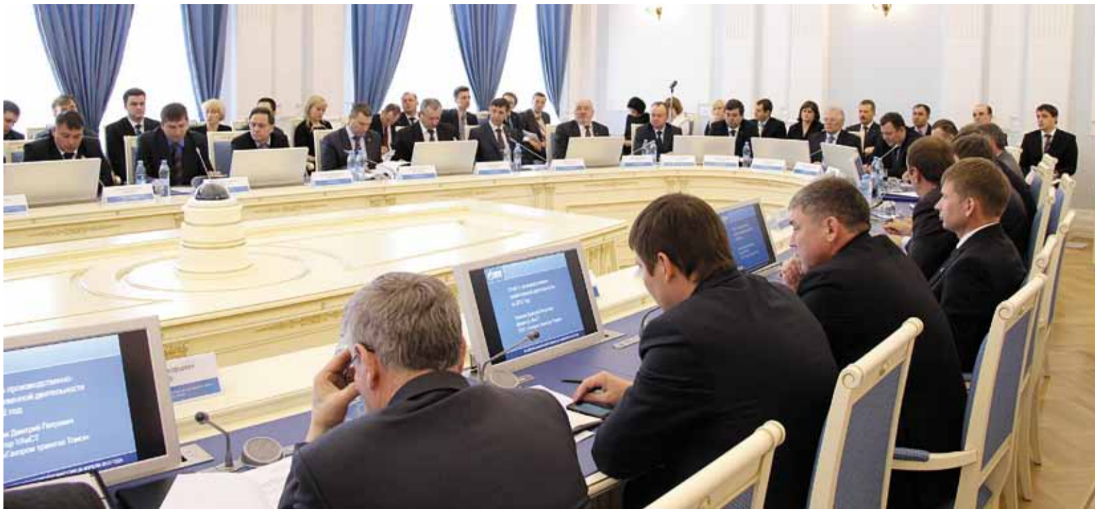
Из отчетов филиалов складывается картина деятельности Общества за год