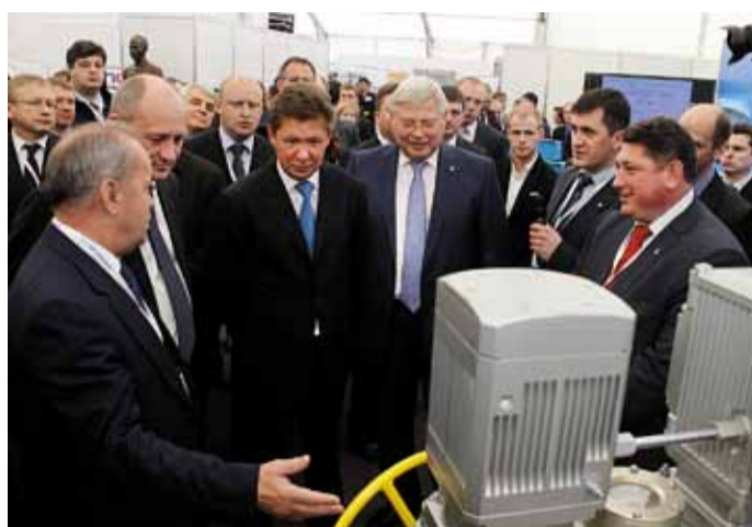
У выставочного стенда «Газпром трансгаз Томск»

пром трансгаз Томск» за последние девять лет вырос в десять раз. Существенным фактором стало развернувшееся рационализаторское движение. Предложения, дающие экономию материальных, финансовых, энергетических ресурсов, улучшение условий труда и экологии, отражают профессионализм, творческий подход и, главное, желание привнести в рабочий процесс полезную инженерную находку. По факту каждый пятый сотрудник компании – рационализатор. Доказанный экономический эффект от рационализаторских предложений в 2012 году составил более 74 млн руб., а уже за 1 квартал 2013 года – более 30 млн руб.