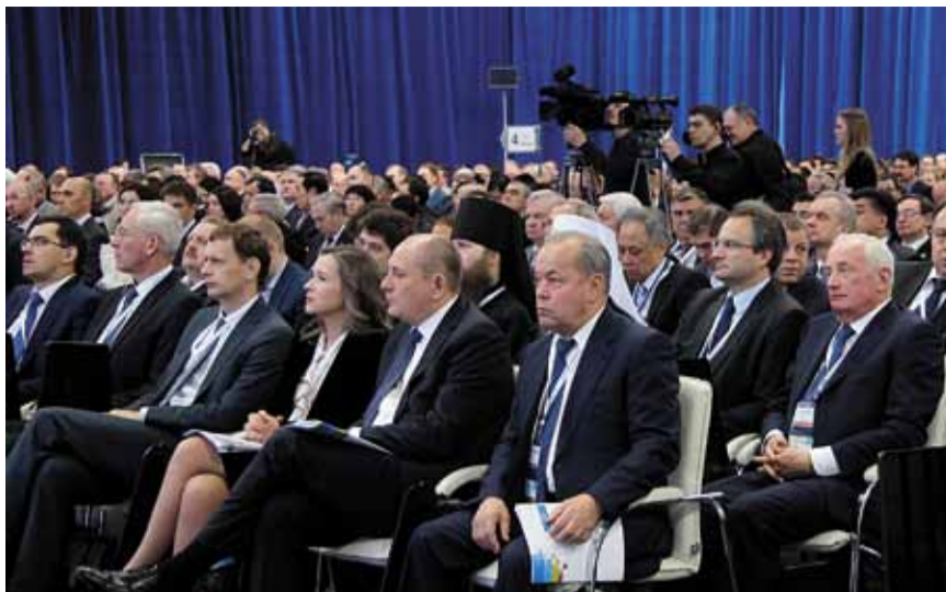
В работе форума приняло участие более полутора тысяч делегатов