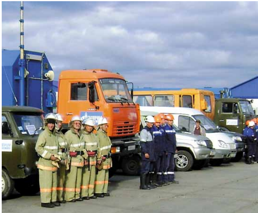
Во всех филиалах Общества были готовы к паводку