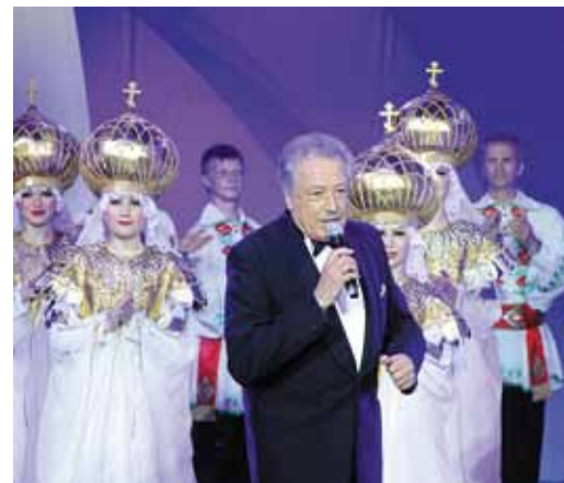
Святослав Бэлза – бессменный председатель жюри