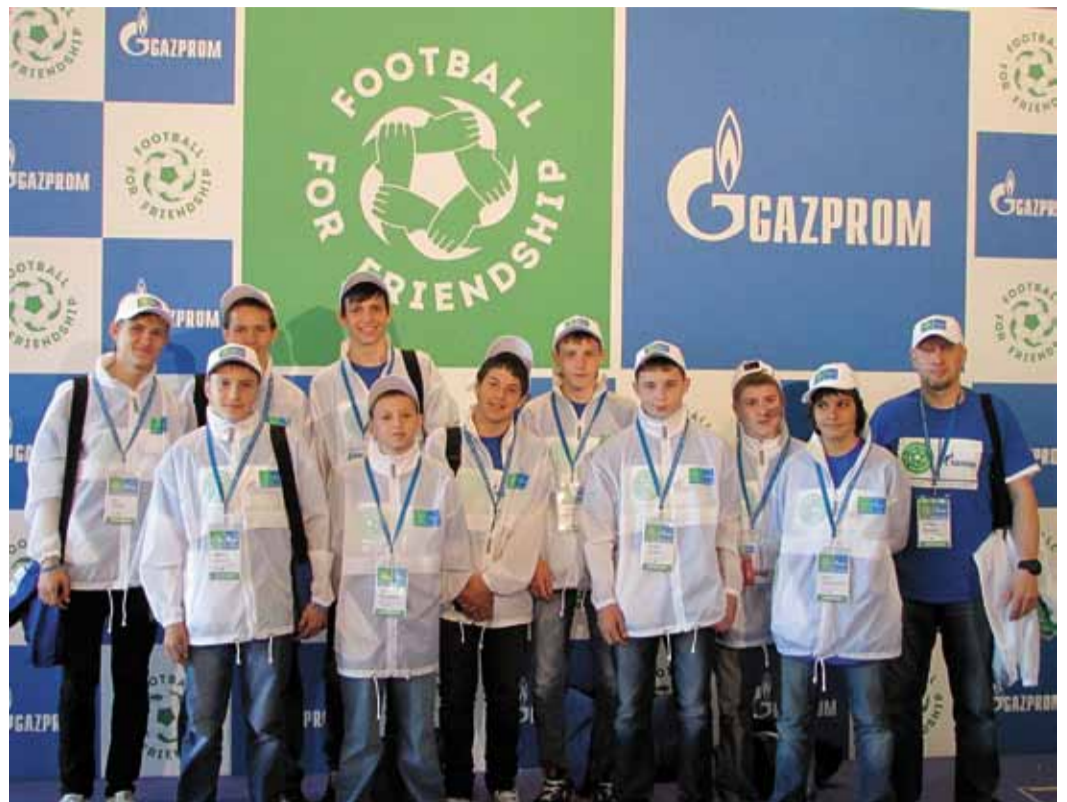
Этим ребятам можно позавидовать – они своими глазами видели футбол на арене стадиона «Уэмбли»

– «Сила Сибири» – это вдвойне символическое название. Во-первых, мы повезли в Лондон молодую талантливую команду, она говорит о том, что в Сибири есть перспективные футболисты, это наша сила. Во-вторых, «Газпром трансгаз Томск» стоит на пороге строительства крупнейшего объекта, магистрального газопровода Якутия – Хабаровск – Владивосток, который по решению президента РФ Владимира Путина получил название «Сила Сибири». Два проекта развивались параллельно, поэтому было принято решение объединить их одним названием.