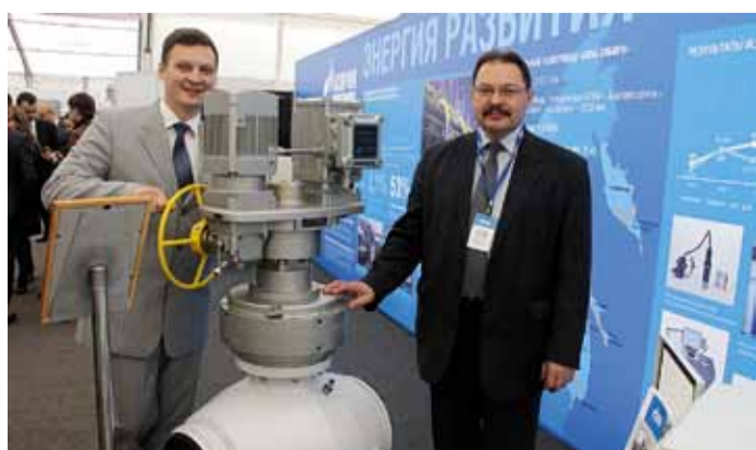
В «Газпром трансгаз Томск» с каждым годом растет число рацпредложений