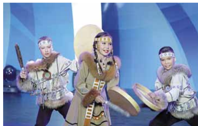
Оленята в танце «Моя Камчатка»

есть интрига и многоплановость, как в любой шахматной партии.