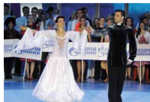
Церемония открытия фестиваля

подготовила новую песню «Ты взойди, красно солнышко», которую исполнила а cappella.