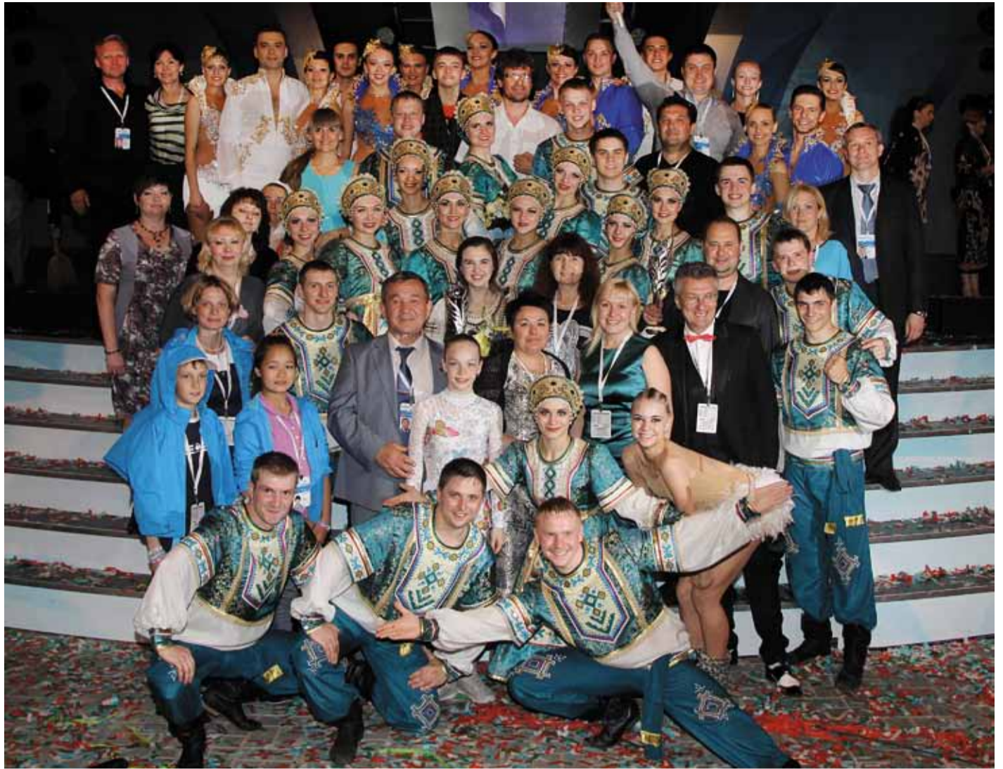
Мы – команда победителей!