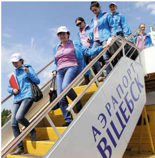
Здравствуй, гостеприимный Витебск!

Первый день пребывания на белорусской земле оказался познавательным. Насыщенная >>>