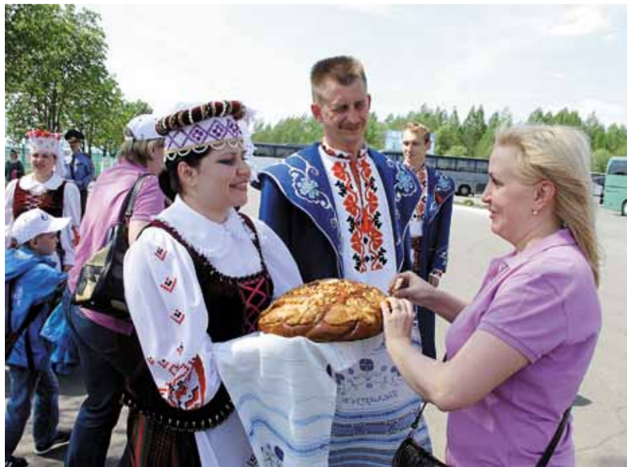
Хлеб-соль от радушных хозяев