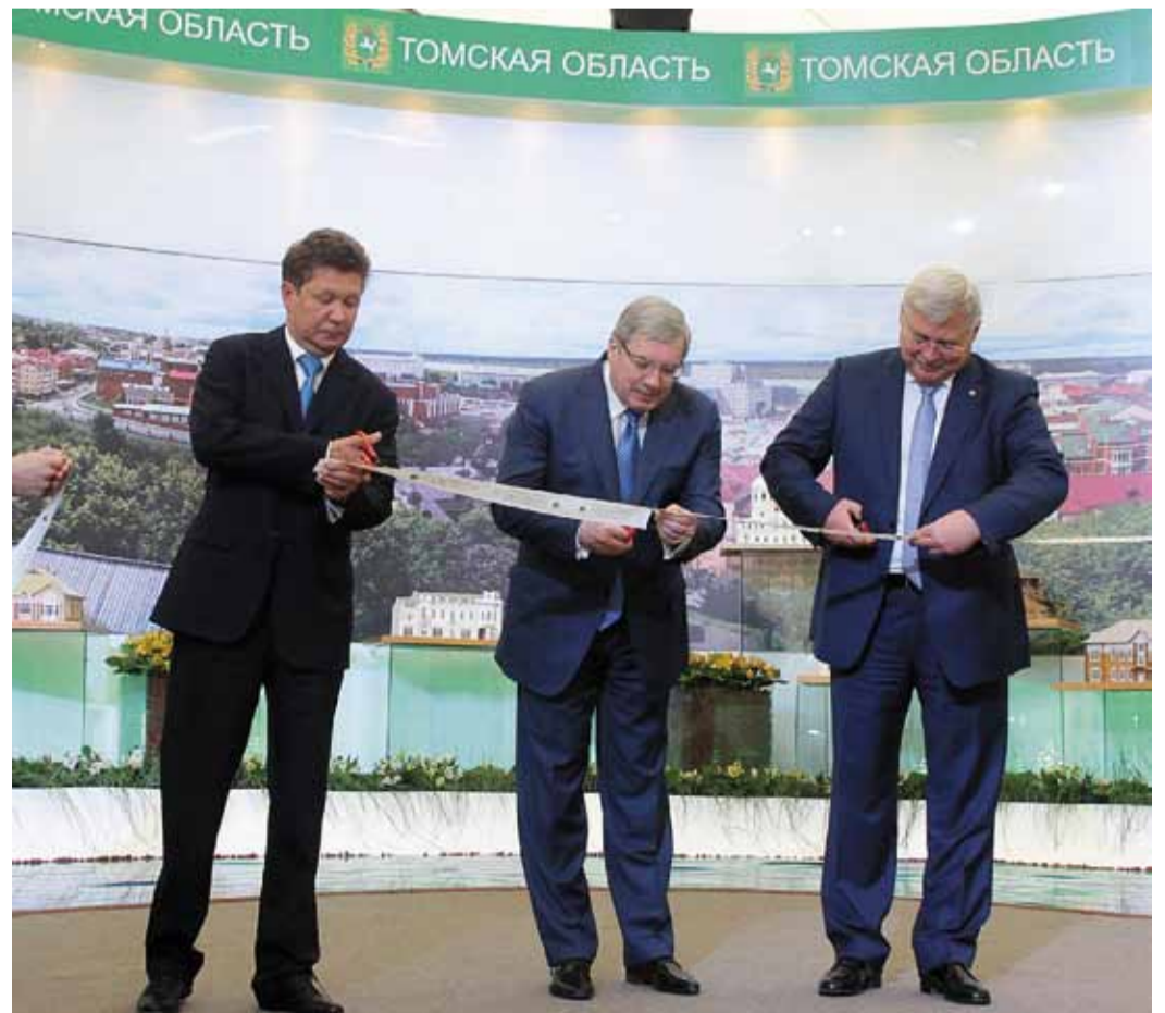
Алексей Миллер, Председатель Правления ОАО «Газпром», Виктор Толоконский, Представитель Президента РФ в СФО, и Сергей Жвачкин, губернатор Томской области, во время открытия форума