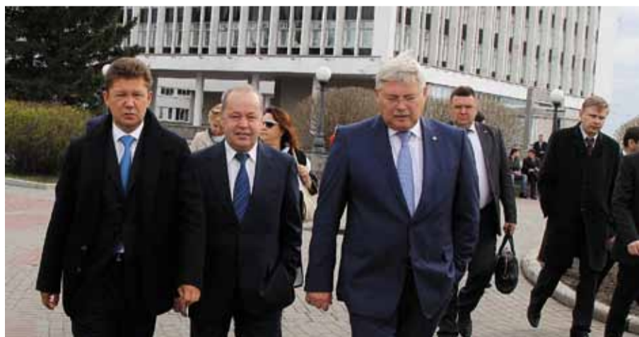
Алексей Миллер познакомился с проектом «Томские бережные» и с удовольствием прошел по улицам города