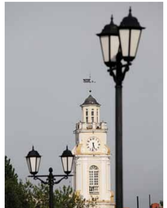
Старая ратуша – визитная карточка Витебска