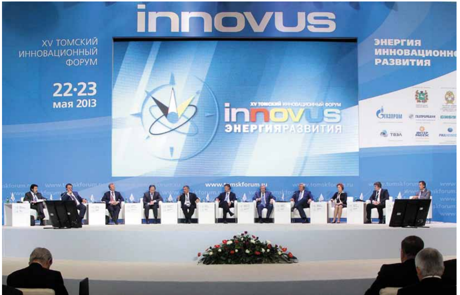
Во время пленарного заседания прозвучали доклады основных спикеров, в том числе Алексея Миллера, Председателя Правления ОАО «Газпром»

Кстати сказать, взаимное притяжение и синергетический эффект взаимодействия сырьевых отраслей с инновационной экономикой стали одной из главных тем на юбилейном форуме. Одним из примеров успешного научно-технического сотрудничества компании «Газпром трансгаз Томск» и научных организаций являются разработки Томского политехниче-