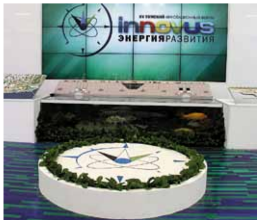
Компас – символ форума, как ориентир для науки, производства и технологий