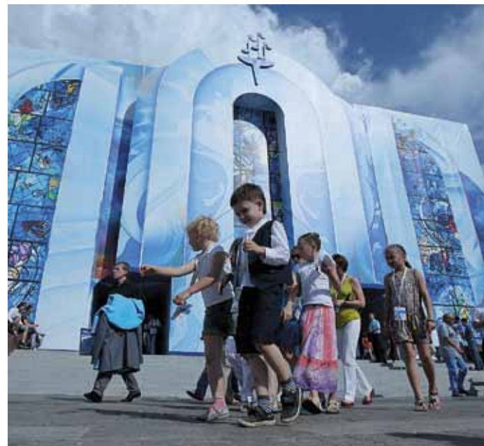
Символика «Факела» стала украшением Витебска